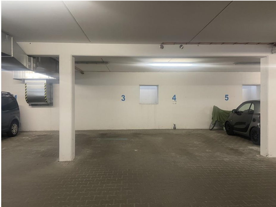
Beispiel Stellplatz Tiefgarage

K-Immobilien GmbH · Teplitzer Straße 4 · 84478 Waldkraiburg · Deutschland