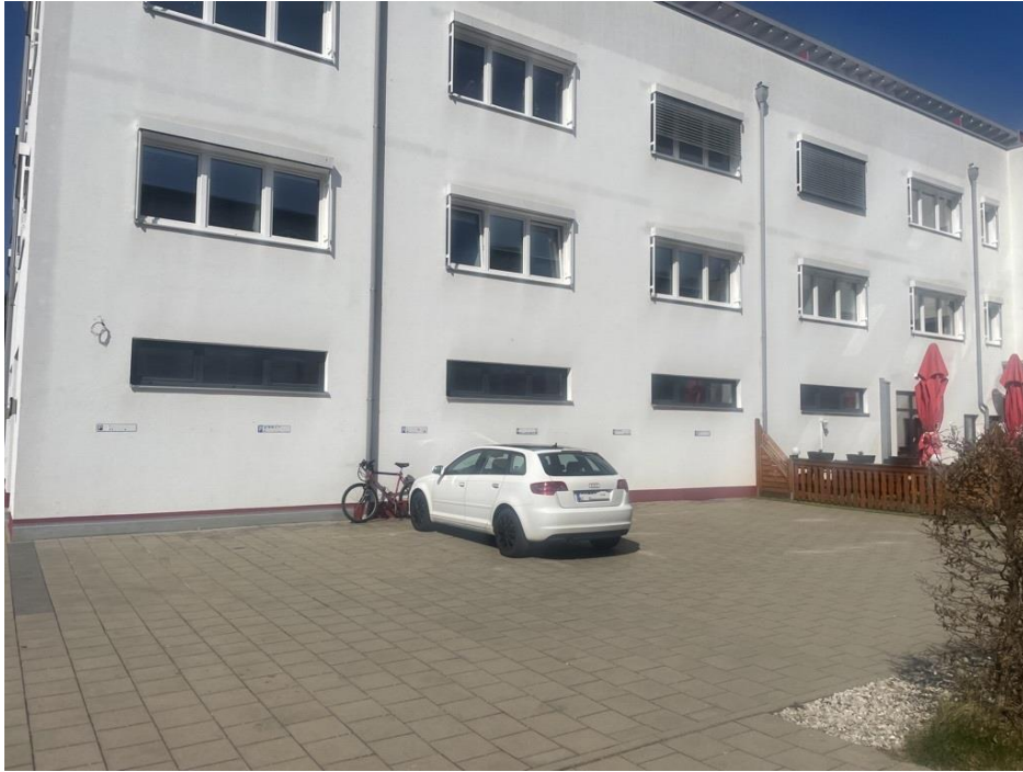
Beispiel Stellplatz Innenhof

K-Immobilien GmbH · Teplitzer Straße 4 · 84478 Waldkraiburg · Deutschland Phone +49 (0) 86 38 98160-209 · Telefax +49 (0) 86 38 98160-29 E-Mail: info@k-verwaltung.de